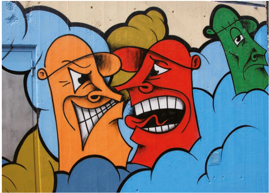
Schreien bringt nichts – Konflikte sollten auf der Sachebene ausgetragen werden.

Auf der Beziehungsebene ist der gegenseitige Respekt voreinander die Grundlage jeder Konfliktlösungsstrategie. Nur wer die Persönlichkeit seines Gegenübers in ihrer Unterschiedlichkeit wertschätzt, kann auf Augenhöhe mit ihm kommunizieren. Ein Konfliktlösungsprozess muss unter anderem die Rollenverteilung im Projektteam klären. Ausserdem muss er